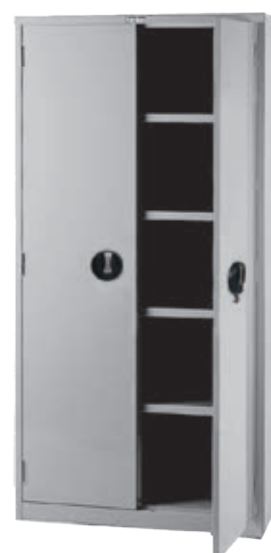
● EF-36D H1760xW900xD465 产品内容：活动棚板4片