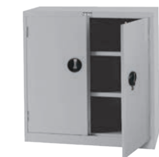
● EF-33D H880xW900xD465 产品内容：活动棚板2片