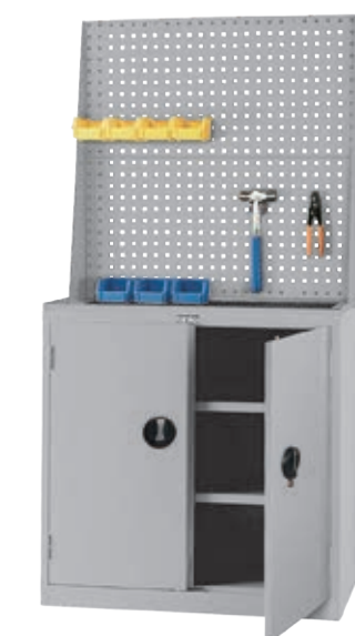
● EF-33D+KQ62 H1788xW900xD465 产品内容：挂板一组+ 活动棚板2片 (不含陈列工具与塑胶盒)